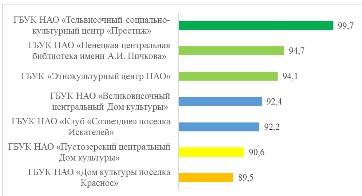
Рисунок – 1 Общий рейтинг по средней оценке организаций культуры, в баллах

По итогам проведения сбора и обобщения данных опроса получателей услуг и информации, размещенной на официальных сайтах организаций культуры Ненецкого автономного округа, получена оценка качества условий оказания услуг этими организациями. Итоговые значения по организациям в общем рейтинге и в разрезе общих критериев качества оказания услуг, представлены на рис. 1-7.