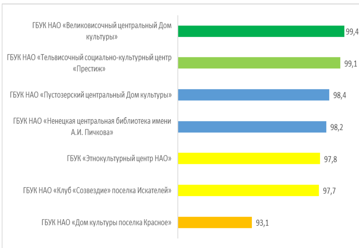
Рисунок – 3 Рейтинг организаций культуры по критерию «Комфортность условий предоставления услуг», в баллах