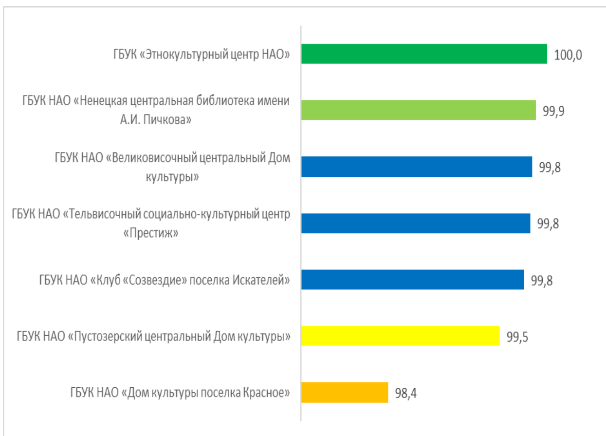
Рисунок – 2 Рейтинг организаций культуры по критерию «Открытость и доступность информации об организациях культуры», в баллах