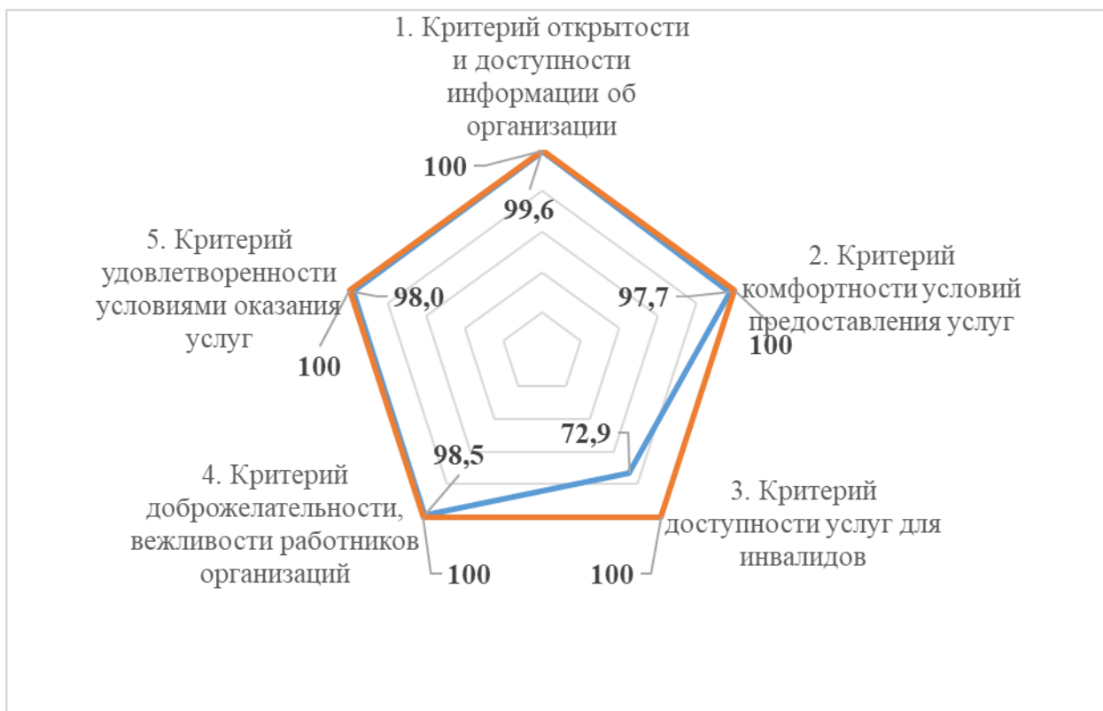
Рисунок – 7 Значения критериев независимой оценки качества условий оказания услуг образовательными организациями НАО в 2021 году

Значения показателей, характеризующих общие критерии оценки качества условий оказания услуг всеми 7 организациями культуры Ненецкого автономного округа, представлены в табл. 15.