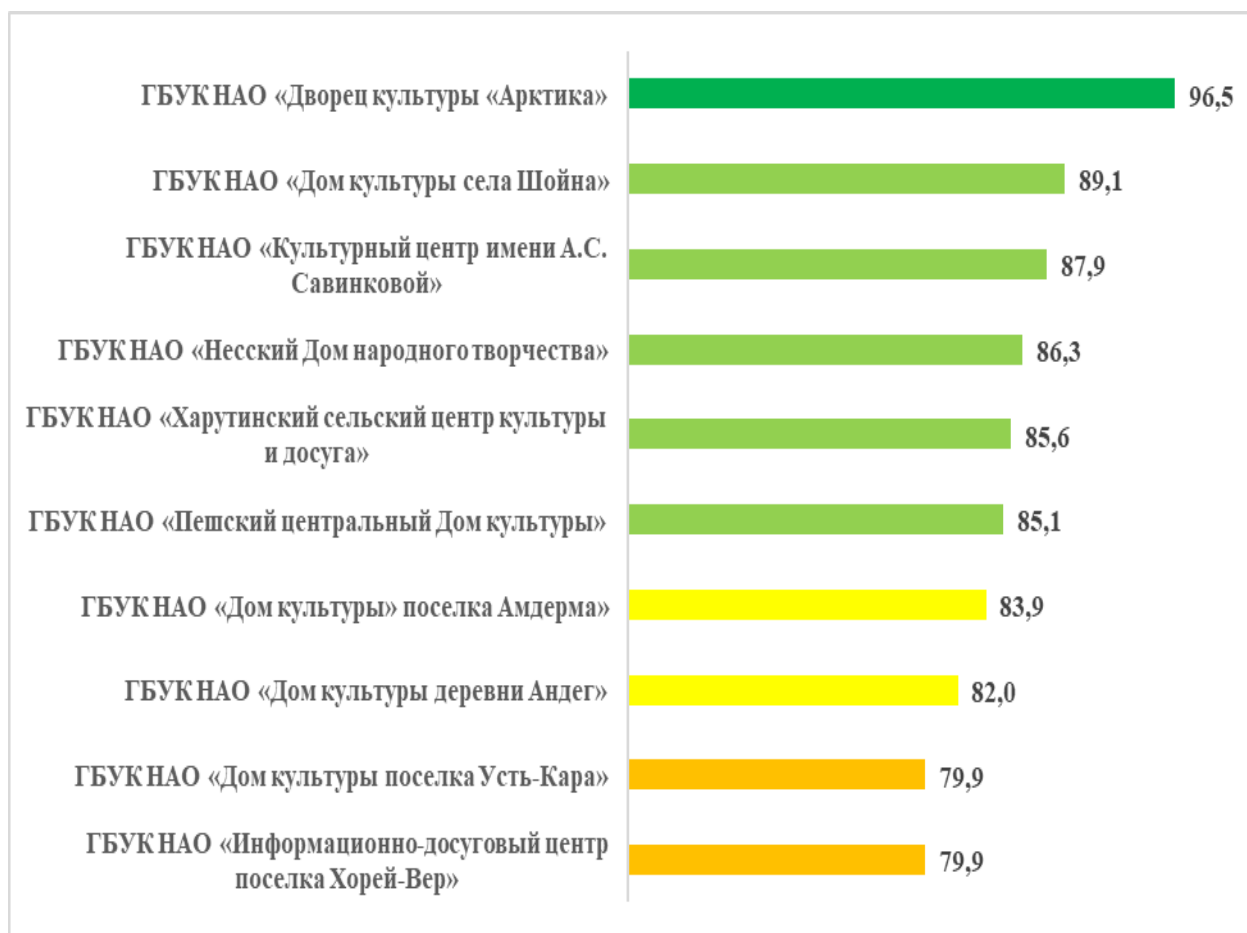
Рисунок – 1 Общий рейтинг по средней оценке организаций культуры, в баллах

По итогам проведения сбора и обобщения данных опроса получателей услуг и информации, размещенной на официальных сайтах организаций культуры Ненецкого автономного округа, получена оценка качества условий оказания услуг этими организациями. Итоговые значения по организациям в общем рейтинге и в разрезе общих критериев качества оказания услуг, представлены на рис. 1-б.