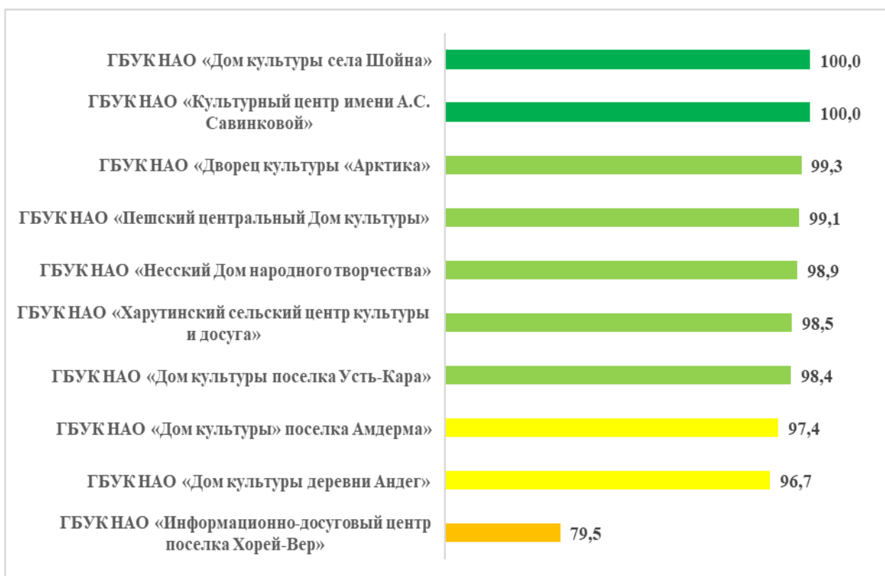
Рисунок – 5 Рейтинг организаций культуры по критерию «Доброжелательность, вежливость работников организаций культуры», в баллах