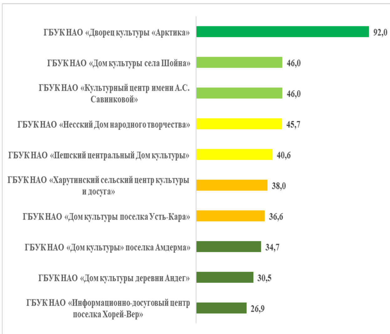
Рисунок – 4 Рейтинг организаций культуры по критерию «Доступность услуг для инвалидов», в баллах