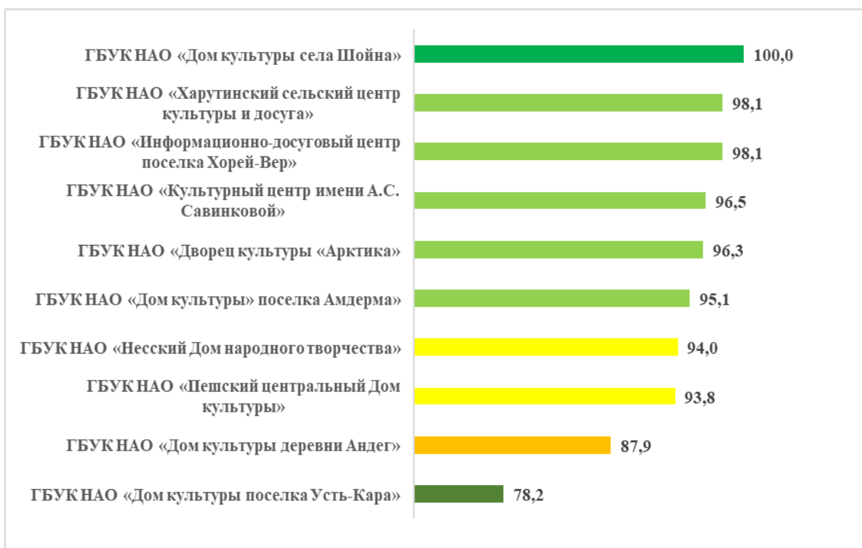
Рисунок – 3 Рейтинг организаций культуры по критерию «Комфортность условий предоставления услуг», в баллах