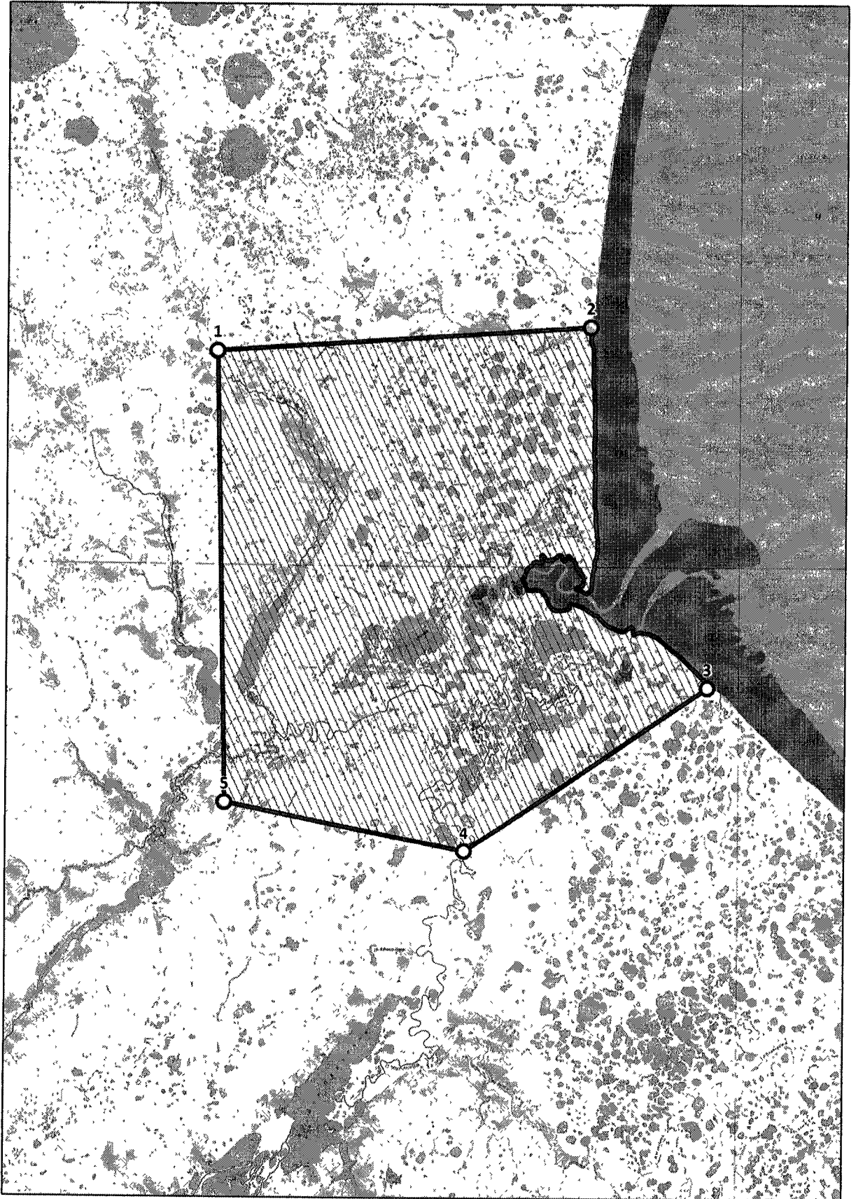
Рисунок 15. Карта-схема границ охотничьего участка № 6, планируемого к закреплению.»